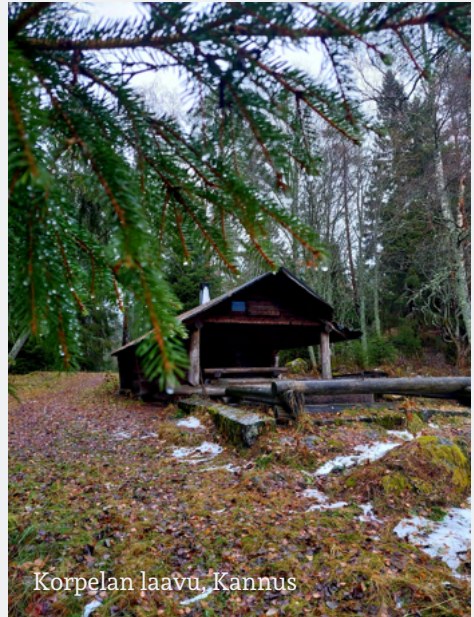
Korpelan laavu, Kannus