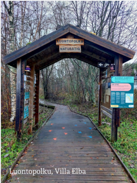
Luontopolku, Villa Elba