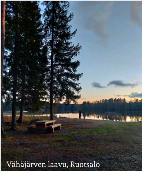
Vähäjärven laavu, Ruotsalo