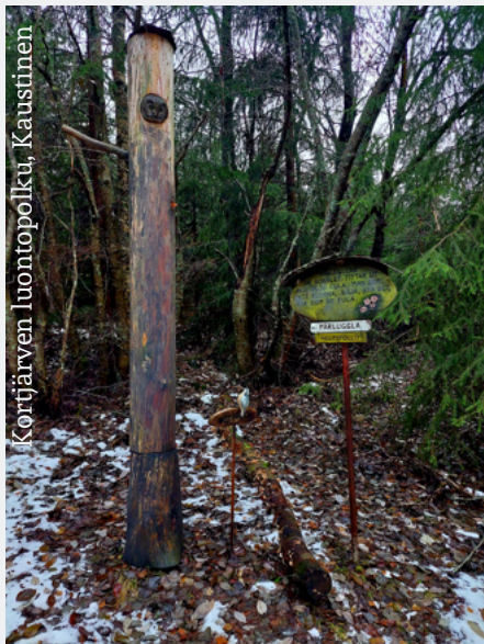
Kortjärven luontopolku, Kaustinen