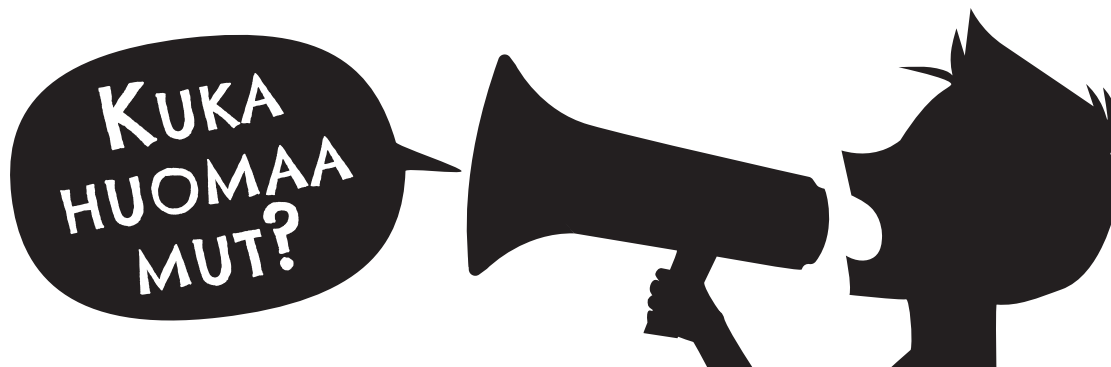
Kuka huomaa mut? -hankkeen uusi logo.