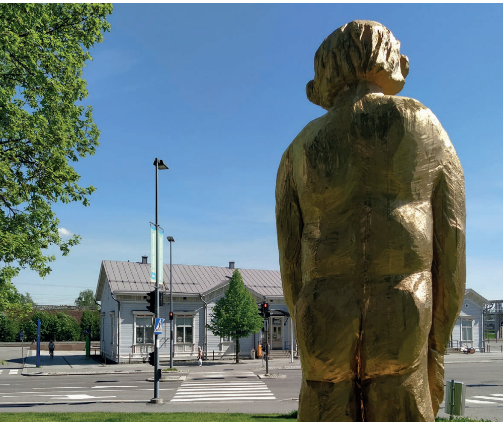
Miesten asema on vakiintunut uuteen toimipaikkaansa Mikkelin rautatieasemalle.

Päihdetaustaisille äidille ja vauvoille tarjotaan elokuussa alkavan Kieppi-ryhmän lisäksi tukikäyntejä kotiin, kokemus-asiiantuntijan tukea ja ryhmän jälkeistä kotiin vietävää tukea vauvaperheohjaajalta. Aurora-hankkeen kautta perheillä on myös mahdollisuus pariterapiaan. Kiepin kautta muutkin Violan palvelut ovat ryhmäläisten käytettävissä. ■