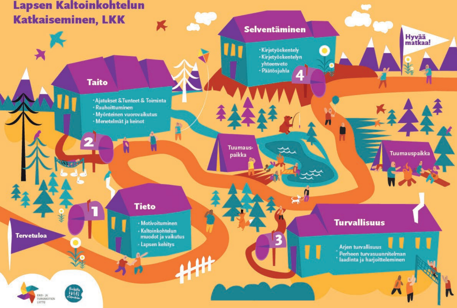
Lapsen Kaltoinkohtelun Katkaiseminen (LKK) työskentelymallin posterit.