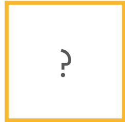
JOKU MUU Kuka?